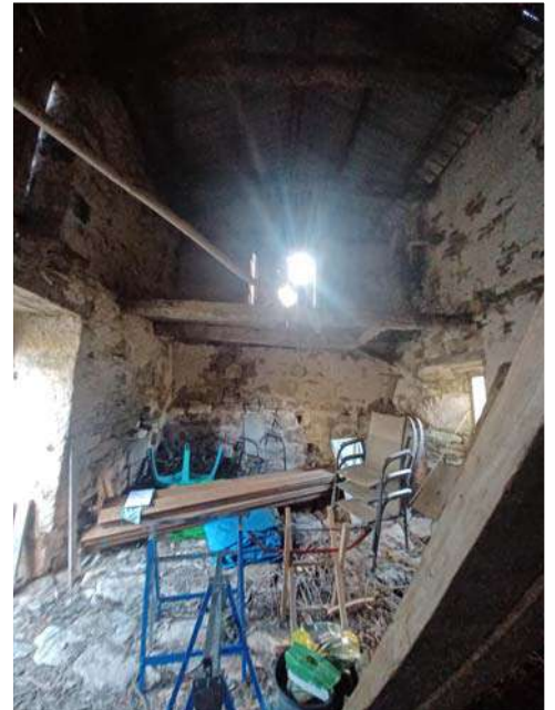
Vue 12 Intérieur