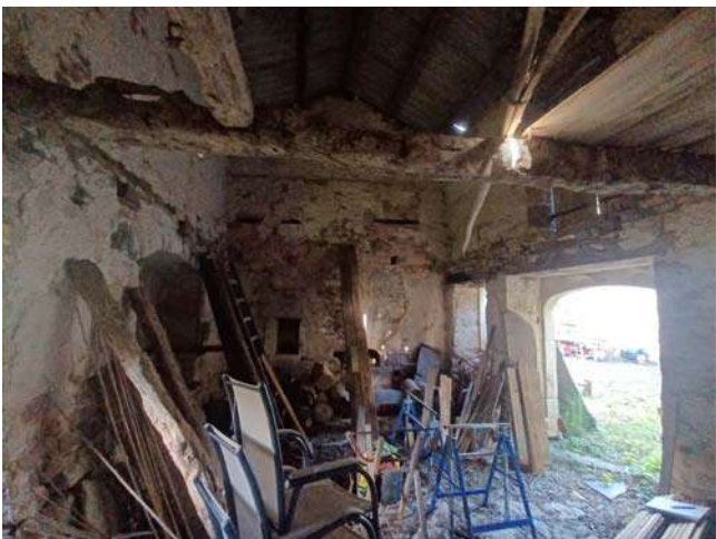
Vue 11 Intérieur